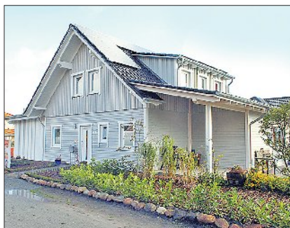
Das schicke Wohnhaus am Ahnbeker Ring wurde in innovativer Holzbauweise errichtet.