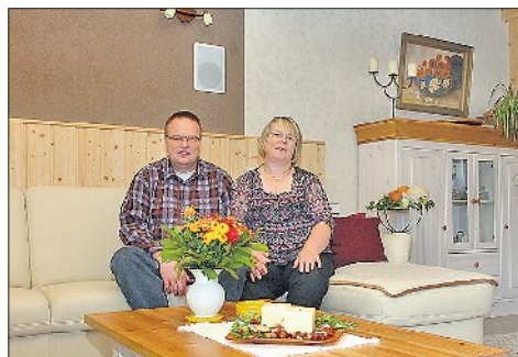
Die gemütliche Gestaltung der Innenräume ist ein Werk von Frauke Romaus.

rechte Wohnungen, aber auch die helfende Hand in allen Lebenslagen, die der sympathische Ganderkeseer seinen Kunden gerne reicht.