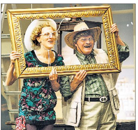
Um „kosmisch mobile Kunst“ geht es am Dienstag, 26. Oktober, ab 20 Uhr, im Kleinen Haus.

mit seinem Wasserkocher und der Steckdose. Kaschtan ist überwältigt, er hält den chaotischen Stapel für ein geniales Kunstwerk. Auf die Frage, wie es betitelt sei, ruft Rafis Freundin: „Zieh den Stecker raus, das Wasser kocht“, da der Kessel gerade seinen Dienst tut. Das überzeugt Kaschtan vollends. Raphael Schlesinger wird vermarktet. Seine „kosmische mobile Kunst“ hat Erfolg und verkauft sich zu horrenden Preisen. Doch Raphael wird immer unzufriedener. Kurz vor einer wichtigen Ausstellung erträgt er es nicht mehr und versucht, seinen eigenen „Erfolg“ zu boykottieren, doch alle halten seinen Protest für einen Reklametrick. Selbst eine farbbelegte Leiter wird kurz entschlossen zur „Weltkunst“ erklärt. ■ Kartenvorverkauf: Telefon (04221) 1 65 65. (nba)